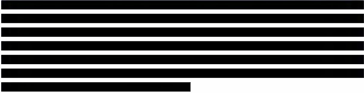
Rysunek 1. Schemat selekcji analiz ekonomicznych – cukrzyca typu 1