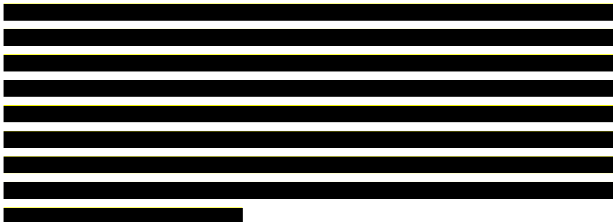
Tabela 1. Część horyzontu, w którym generowane będą oszczędności dla płatnika publicznego w zależności od daty wydania decyzji refundacyjnej